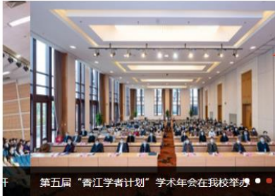
第五届“甬江学者计划”学术年会在我校举办